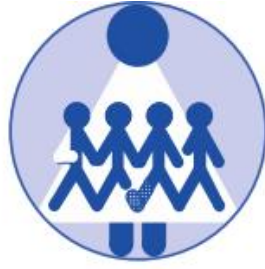
FSOS – Fagligt selskab for ortopædkirurgiske sygeplejersker

Skandinavisk konferens Ortopedisk omvårdnad Tema: Det livslånga lärandet