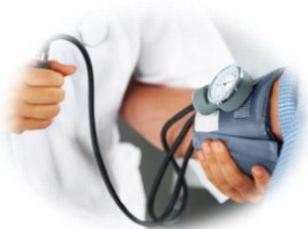
قياس ضغط الدم